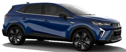
Modra Royal kovinska (RQH)