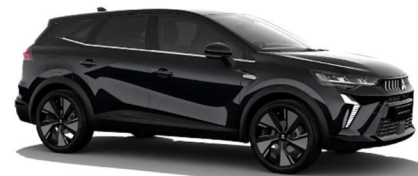
Črna Onyx kovinska (GNE)