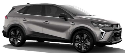
Siva Steel kovinska (KNG)