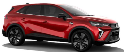
Rdeča Sunrise biserna (NNP)