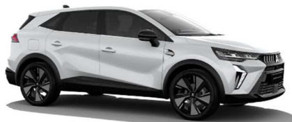
Bela Crystal biserna (QNC)